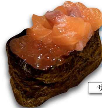
サーモン親子軍艦