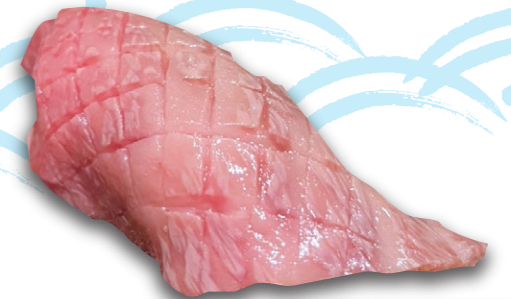
和牛炙りサーロイン